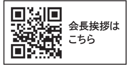
会長挨拶はこちら