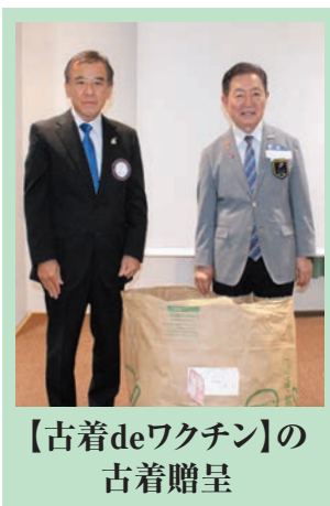
【古着deワクチン】の古着贈呈