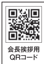
会長挨拶用 QRコード

富士RC創立60周年記念式典に参加し、他クラブの会長幹事から「IM大成功」とのお褒めの言葉をいただきました。12クラブある第2グループではIMを開催できる大きな会場が地元が無い、とのご意見が多くありました。また物価高対策で例会数を減らすというクラブが他にもありました。今回参考になった事は今後のクラブ運営に反映させたいと思います。