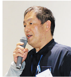
御殿場市地域包括支援センター あすなろ