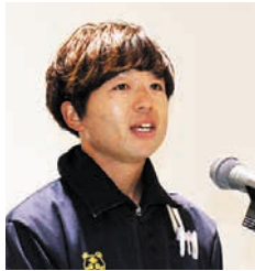
御殿場市地域包括支援センター あすなろ