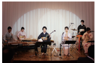
藝大邦楽女史Bob'ズの 皆さま