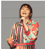
オープニングソング 結花乃様