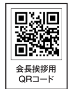
会長挨拶用 QRコード

ご承知のように、今年度のR1のテーマは「ロータリーは世界をつなぐ」です。ロータリーは良いことのために、人びと、地域社会、国々をつないでいます。私はまた「ロータリーは人々をつなぐ」とも思っています。本日のIMを通して静岡第2グループ12クラブ400余名のメンバーが共に奉仕を学び、親睦を深め、そして新たな出会い、つながりを築いていかれることを期待します。