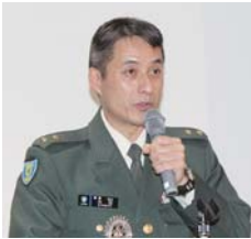
陸上自衛隊富士教導団長 陸将補