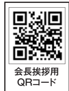
会長挨拶用 QRコード

大手の旅行会社などテロ被害の当事者となると大変ですが、実際直面していない会社にとっても対応には苦労しています。テロとか自然災害などが旅行中に起きない様に常に願っているのが我々の業界です。